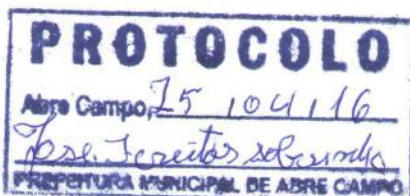
Márcio Moreira Vítor Prefeito Municipal